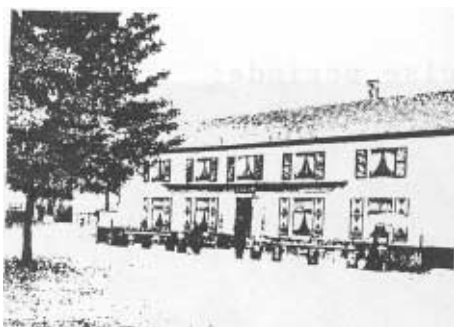
Herberg De Keizer, Wechelderzande 1886