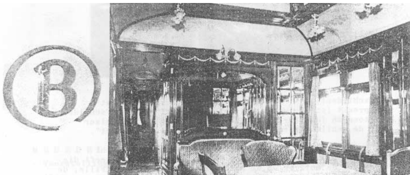
Een kijkje in het salonrijtuig van de koninklijke trein. Henry Van de Velde ontwierp zoals nu blijkt het interieur van het salon-, slaap-, en restauratierijtuig.

Slechts in 1988 is men te weten gekomen dat hij ook de ontwerper was van een koninklijke trein. In 1937 oordeelde het bestuur van de NMBS dat de koning voor zijn verplaatsingen behoefte had aan een nieuwe trein. Er werd besloten drie metalen rijtuigen: een salon-, restauratie- en slaaprijtuig te laten bouwen. De nieuwe koninklijke trein kwam in dienst naar aanleiding van het officieel bezoek van koningin Wilhelmina van Nederland aan Brussel, op 23 mei 1939.