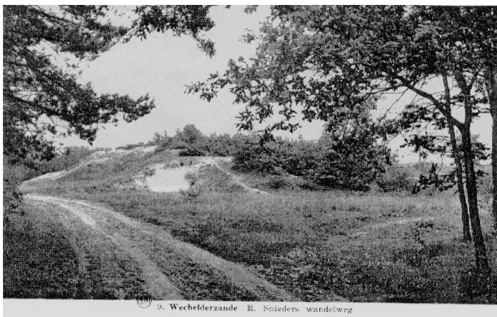
9. Wechelderzande R. Snieters wandelweg

Willaert wordt ook verbasterd tot wildert. Dit is een wild begroeid, onvruchtbaar stuk grond, heide of moerassig gebied.