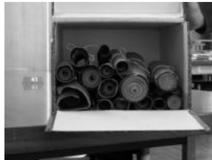
De Hertogelijke cijnsrollen van “Het Land van Turnhout” d.d. 1340.