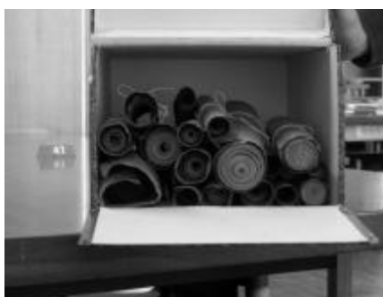
De Hertogelijke cijnsrollen van "Het Land van Turnhout" d.d. 1340.