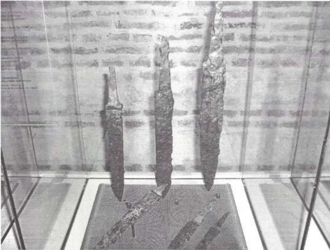
Frankische zwaarden (scramasax) uit het historisch museum te Cambrai.

Het Frankische rijk raakte na de dood van Lodewijk de Vrome verdeeld en bij het Verdrag van Verdun werd Kamerijk in 843 onderdeel van het zgn. Middenrijk of Lotharingen. In 870 kwam het door het Verdrag van Meerssen d.d. 870 na Christus bij het Oost-Frankische Rijk, het latere Heilige Roomse Rijk (Duitse Rijk). In dit oostelijke rijk ontwikkelde zich een stelsel waarbij kerkelijke waardigheidsbekleders wereldlijke macht kregen uit handen van de keizer. Zo gaven de Duitse keizers de bisschop van Kamerijk in 947 de wereldlijke (grafelijke) macht over de stad Kamerijk en in 1007 ook over het Kamerijkse. Hierdoor ontstond een tweeslachtige situatie: de graaf-bisschop van Kamerijk was politiek een vazal van de Duitse keizer, terwijl hij kerkelijk ondergeschikt was aan de aartsbisschop van Reims, die traditioneel de Franse koningen zalfde. Tegelijk vormde het bisdom Kamerijk een personele unie met het bisdom Atrecht (tot de 11e eeuw), dat tot het Franse koninkrijk behoorde. De relatie tussen de graaf-bisschop en de stedelingen van Kamerijk was vaak gespannen. Door de investituurstrijd raakte het bisschopsambt verzwakt en konden de burgers in 1077 gemeentelijke privileges van hun graaf-bisschop afdwingen, die Kamerijk tot een van de oudste stadsgemeenten van Noord-Frankrijk maakten. Aan het begin van de 13e eeuw zou de graaf-bisschop zijn greep op de stad opnieuw versterken, wat herhaaldelijk tot confrontaties en financiële crises leidde.