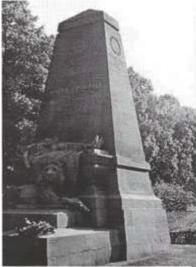
Grafzerk van Hendrik Conscience