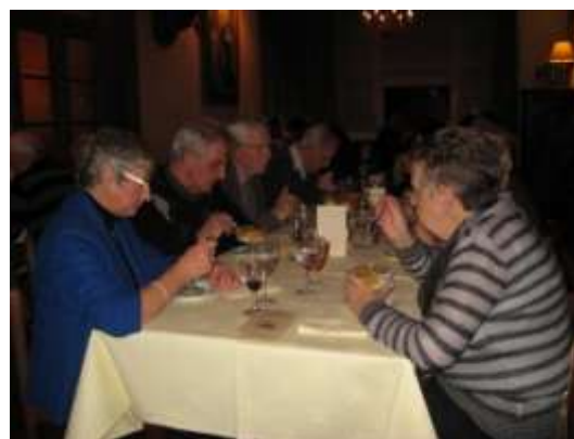
Een greep uit de ingestuurde menu's.