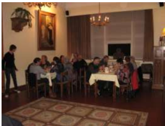
Een tevreden gastheer.

Het Kloosterhof in Gierle was een uitgelezen plaats om ons eerste teerfeest te houden, dat met 50 deelnemers zeker een succes kan worden genoemd.