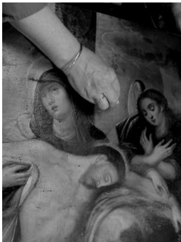
Tijdens de vernisafname

Alle drie de schilderijen werden in de 17e eeuw geschilderd door een anoniem kunstenaar, want we vinden geen enkele signatuur of monogram. De stijl van het eerste en het tweede werk is zeer vergelijkbaar, hoewel de werken duidelijk niet van dezelfde hand zijn. Stilistisch kunnen ze worden ondergebracht in de vroegbarok uit het Antwerpse. Het derde schilderij, "de Pieta" heeft veeleer een maniëristische factuur van vroegere datum en kunnen we situeren in de zestiende eeuw. De plaats van ontstaan is hier moeilijker in te schatten, maar Brabant en de omgeving Brussel zouden hier kunnen